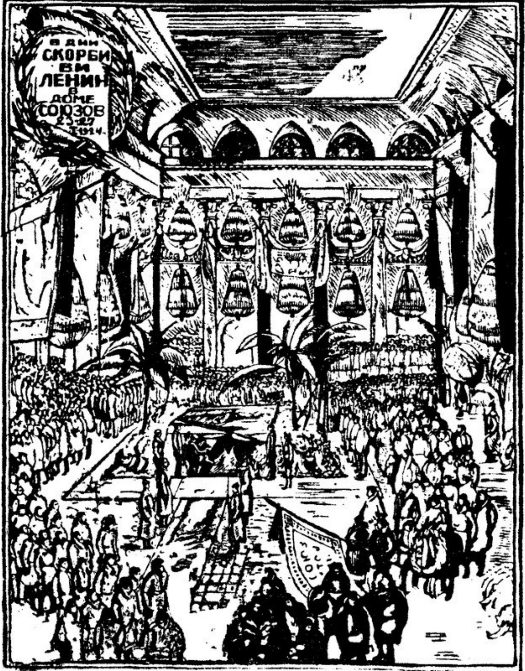
Гравюра на дереве худ. КРАВЧЕНКО.